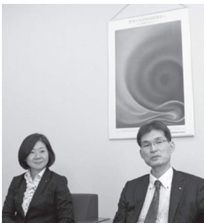
後ろに飾られたポスターは、創業100周年を見据えたビジョン「世界のYAMAMURAへ」を啓発するため作成されたもの

制はまだまだ不十分であり、グローバル事業に対応できる人材の育成は急務でもあります。そのため、まずはテストを実施して社員の現状のレベルを把握することから始めることとしました。